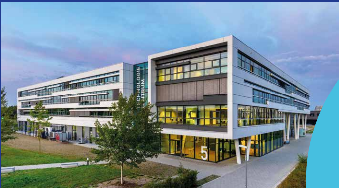
Technologiezentrum Augsburg Sonnenaufgang

Auf einem 70 ha-Gelände siedeln sich dazu Forschungseinrichtungen und Technologieunternehmen an. Das Technologiezentrum im Park ist ein Multifunktionsgebäude mit Halle, Labor-, Technikums-, Büro- und Veranstaltungsflächen. Aktuell sind im Innovationspark rund 15 Forschungseinrichtungen und 55 Unternehmen tätig.